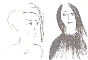
Drawing by Chikara Matsumoto

寺田倉庫アート事業の立ち上げを行った2人の女性によるアートプロジェクト運営デュオ。アートプロジェクトのディレクション、プラン策定、作家や作品の選定、コンサルティングを（主に）企業向けに行う。主なプロジェクトは、寺田倉庫株式会社アート事業、スパイラル/株式会社ワコールアートセンター（TOKYO ART FLOW 00、蒐集衆商、スパイラルアートラウンジ他）、RIMOWA JAPAN株式会社銀座旗艦店オープンアートイベント、文化庁アートサミット事務局、株式会社ピーオーリアルエステート（POLA）アートスタジオ企画、羽田天空橋エリア水辺活性化イベント実行委員会（大田区新たな水辺のにぎわい創出関連事業）、桶田コレクション展覧会、WOW inc.とのアートミュージアムの制作など。