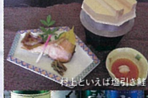
村上といえは塩引き鮭