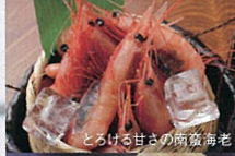
とろける甘さの南砺海老