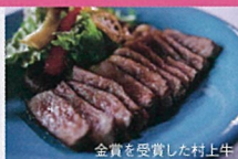
金賞を受賞した村上牛