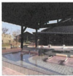
弥彦神社から車で5分～