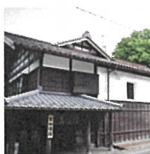
弥彦神社から車で5分～

標高634mの弥彦山を一気に駆け上がるロープウェイ。日本海には遠くに佐渡が浮かびあがります。