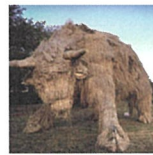
岩室温泉から車で20分

日本海に沈む夕日を楽しめる「白灯台」。日本ロマンチスト協会と日本財団に「恋する灯台」として認定されました。